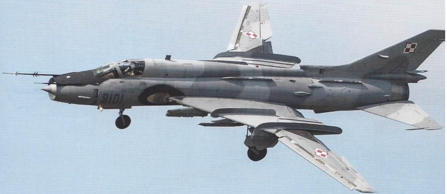
Deze Fitter-K 8101 draait strak in om recht voor de baan te komen.

belangrijkste eenheid van 23 BLT is het 1e Air Tactical Squadron vliegend met de MiG-29. Een andere gestationeerde eenheid is de 2e Search and Rescue Group die met de PZL W-3RL Sokół vliegt.