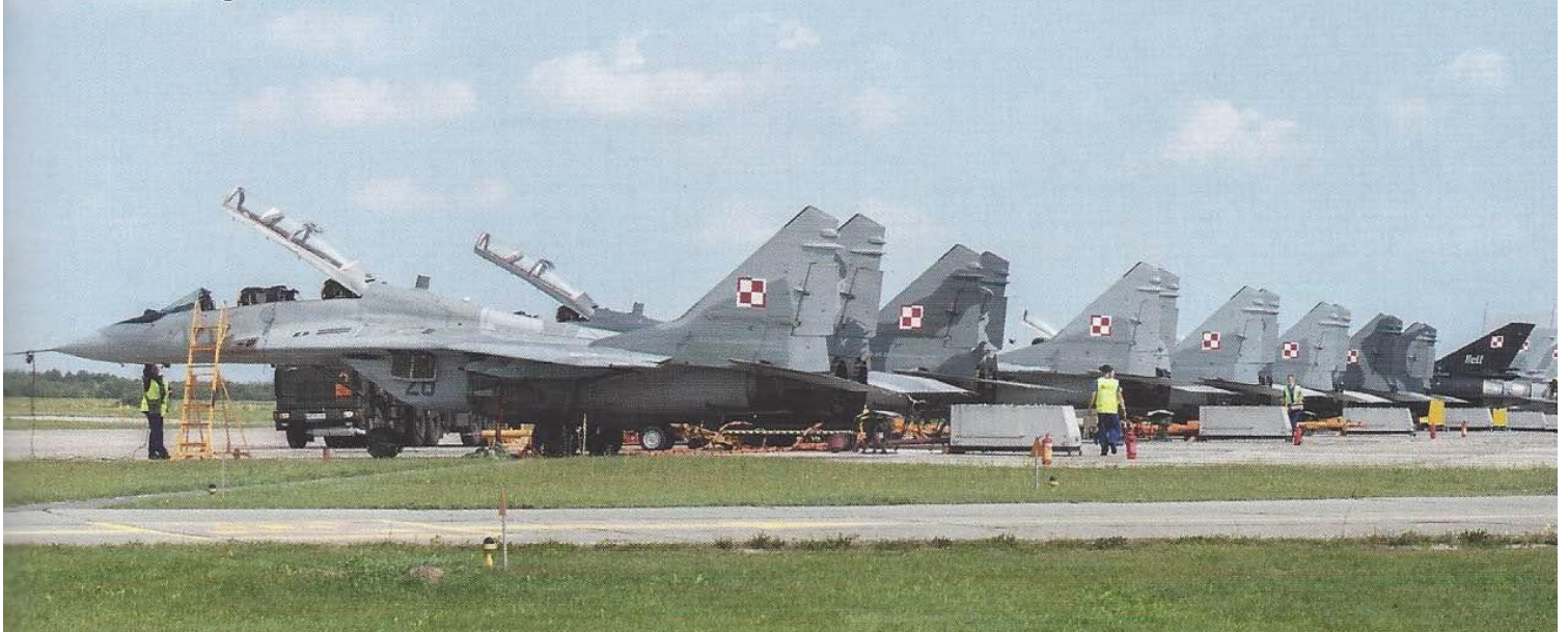
De volle flightline van Mińsk Malowiecki in afwachting van de middagmissie.