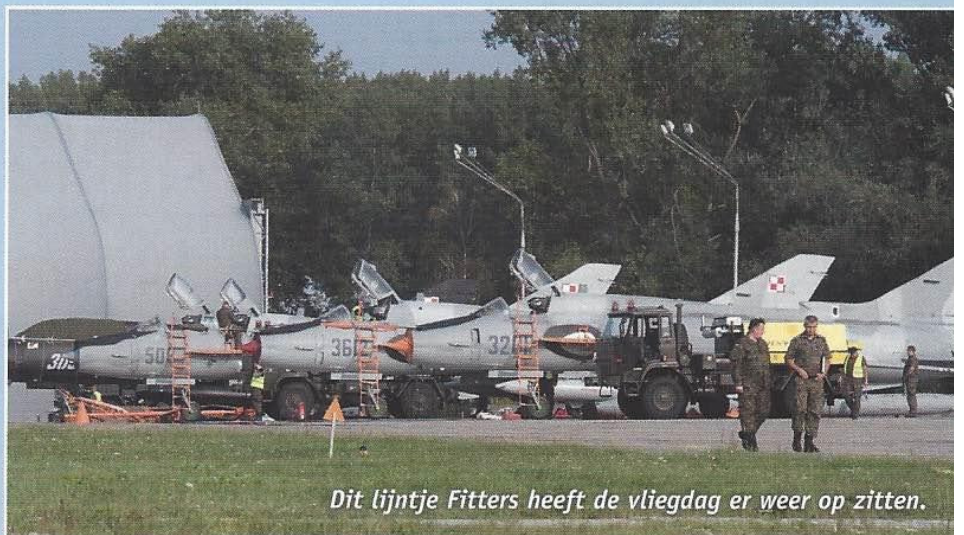
Dit lijntje Fitters heeft de vliegdag er weer op zitten.

Tekst en foto's: Theo van Vliet 24 en 25 augustus 2017