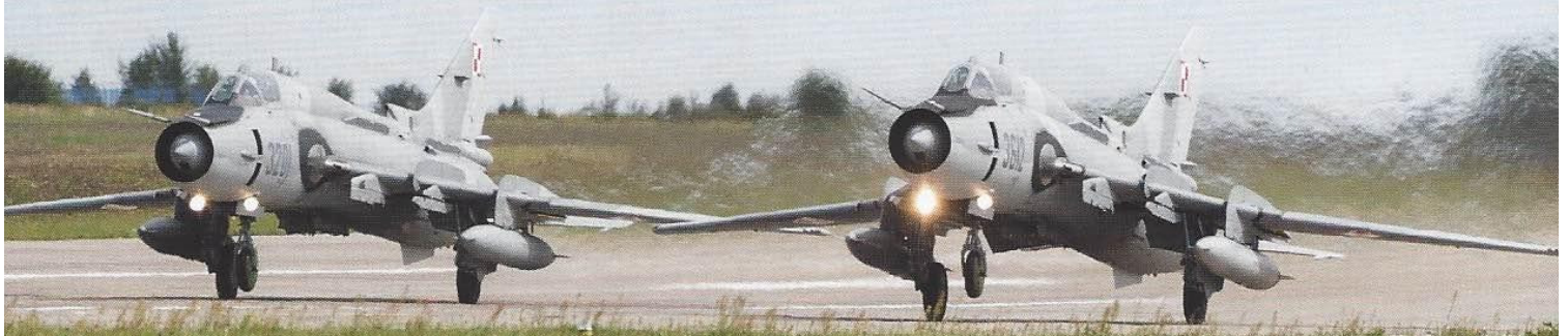
De Su-22 roteert vrij vroeg, lang voordat de hoofdwielen loskomen van de grond.

MiG-29A's en drie MiG-29UB trainers. Deze zijn alle toegewezen aan de 23e Air Base in Minsk Mazowiecki. De waarde van het contract was 126 miljoen zlotych (40 miljoen dollar) en is uitgevoerd in samenwerking met Israël Aerospace Industries. De deal bestond ook uit de levering van logistieke ondersteuning en training voor piloten en technici. De upgrade omvatte onder andere een nieuwe openbron software architectuur avionics suite met een mul-