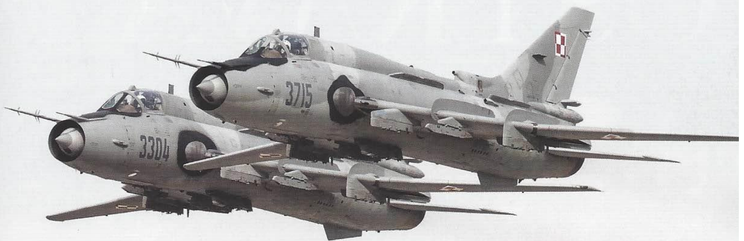
De 3304 en de 3715 verrasten ons met een low pass.

onder alle weersomstandigheden en in volledige samenhang met relevante systemen van NAVO partners. Ondanks het kostbare onderhoud aan de oude toestellen zal de selectie van de opvolger(s) om financiële redenen niet voor 2022 plaatsvinden.